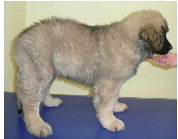
Di angelo, jeune chien avec bassin serré, dos voussé et mauvais aplombs : FTM très élevée. A gauche : Labrador avec hélice inversée qui a du mal à se coucher.

En réunissant tout cela on obtient une méthode de soin très douce, rapide et efficace sur l'homme ou tout autre mammifère.